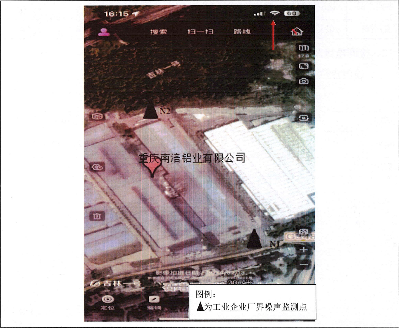
图 1 监测点位示意图