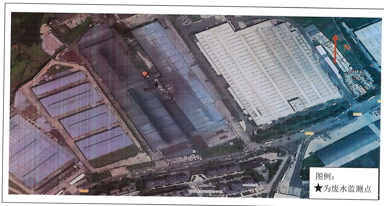
图 1 监测点位示意图